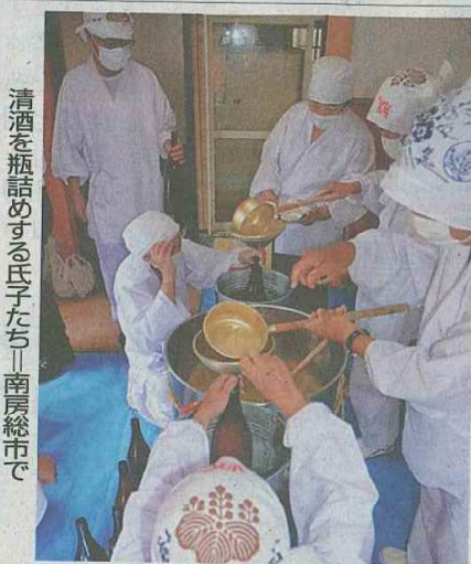
清酒を瓶詰めする氏子たち―南房総市で

南房総市香見の莫越山神社で醸造したお神酒がで上がり、16日に瓶詰め作業が行われた。醸造は約1300年前から行われている神事。神社で酒造りが認められているのは全国で伊勢神宮(三重県)など4社しかなく、関東では莫越山神社だけだ。