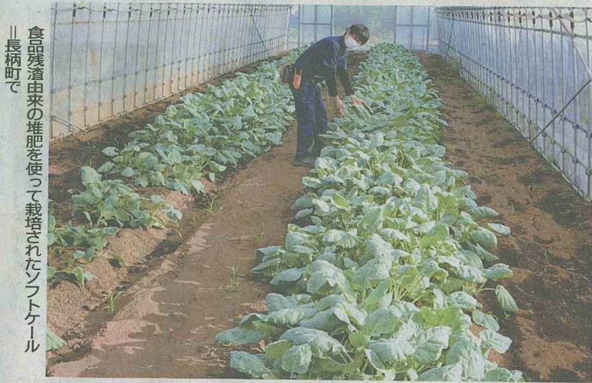
食品残渣由来の堆肥を使って栽培されたソフトケール 長柄町で

のが、全日空の成田市内線のエコノミークラスの機内食工場などで出た食品残渣だ。同町の堆肥工場でチップを混ぜ、約4カ月かけて発酵させて堆肥にした。苗を植えて1〜3カ月後に収穫できる。同社では、これを国際線のエコノミークラスの機内食のサラダに盛り付け、3月から提供を始めた。色合いが豊かで見栄えが良く、苦みを抑えた味で好評という。9月からは第2弾として、ケールのペーστを生地練り込んだフォカッチャーを機上で体験してほしい」と話す。