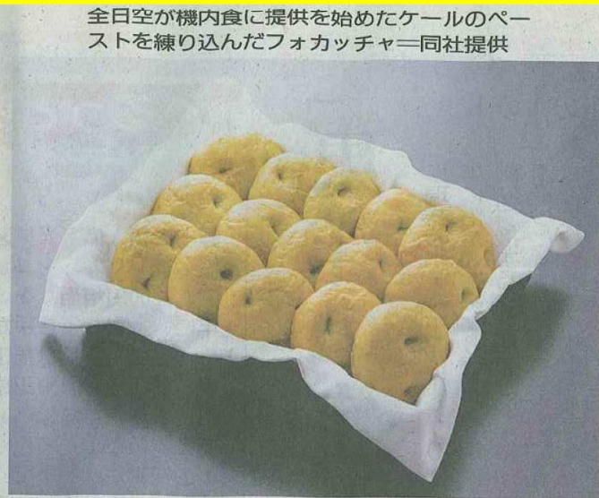
全日空が機内食に提供を始めたケールのペー ストを練り込んだフォカッチャー同社提供

長柄町内の畑の地面を、ケールの大きな葉。この農圃で育てられたソフトケールは、堆肥に使われている。