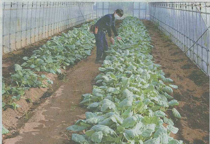
食品残渣由来の堆肥を使って栽培されたソフトケール —長柄町で

のが、全日空の成田市内線のエコノミークラスの機内食工場などで出た機内食のサラダに盛り付けた。色合いが豊かで見栄えが良く、苦みを抑えた味で好評という。9月からは第2弾として、ケールのペーストを生地に練り込んだフォカッチャーを機上で体験してほしい」と話す。