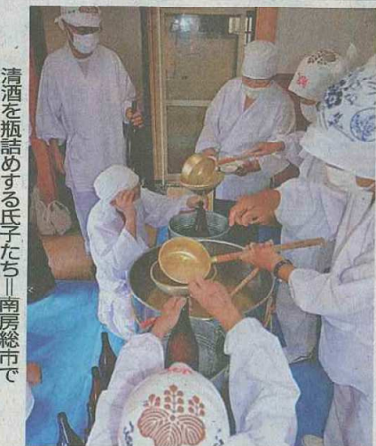
清酒を瓶詰めする氏子たち—南房総市で

南房総市市見の莫越山神社で醸造したお神酒がで上がり、16日に瓶詰め作業が行われた。醸造は約1300年前から行われている神事。神社で酒造りが認められているのは全国で伊勢神宮(三重県)など4社しかなく、関東では莫越山神社だけだ。